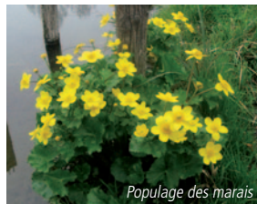
Populage des marais