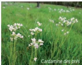
Cardamine des prés

Juste avant la sortie, tournez à droite dans le chemin. Filez tout droit, descendez et longez le bois. Remontez puis tournez à droite, puis à gauche. Longez et vous arrivez sur la route, tournez à gauche puis aussitôt à droite. Longez puis tournez à droite au 2 ème chemin blanc. Au bout, descendez à gauche. À l'intersection, tournez à gauche puis de suite à droite, filez le long du bois et rattrapez la route qui va à Vindelle. Prenez cette dernière sur 800 m environ puis tournez à droite dans le chemin blanc. Continuez celui-ci qui tourne au bout à gauche et empruntez le passage par les pierres qui traverse la Méronne . Un peu plus loin, prenez le chemin à droite et au bout à gauche pour longer la Charente . Vous pourrez admirer la jolie cascade située au-dessous du village de la Chapelle de la commune de Balzac. Longez et vous arrivez à votre point de départ.